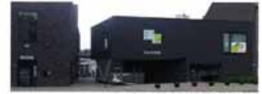
Ingang zaal 1 via Leide 3

Lokaal 1 (is het makkelijkst bereikbaar langs de binnenkoer via Leide 3 en is rolstoeltoegankelijk)