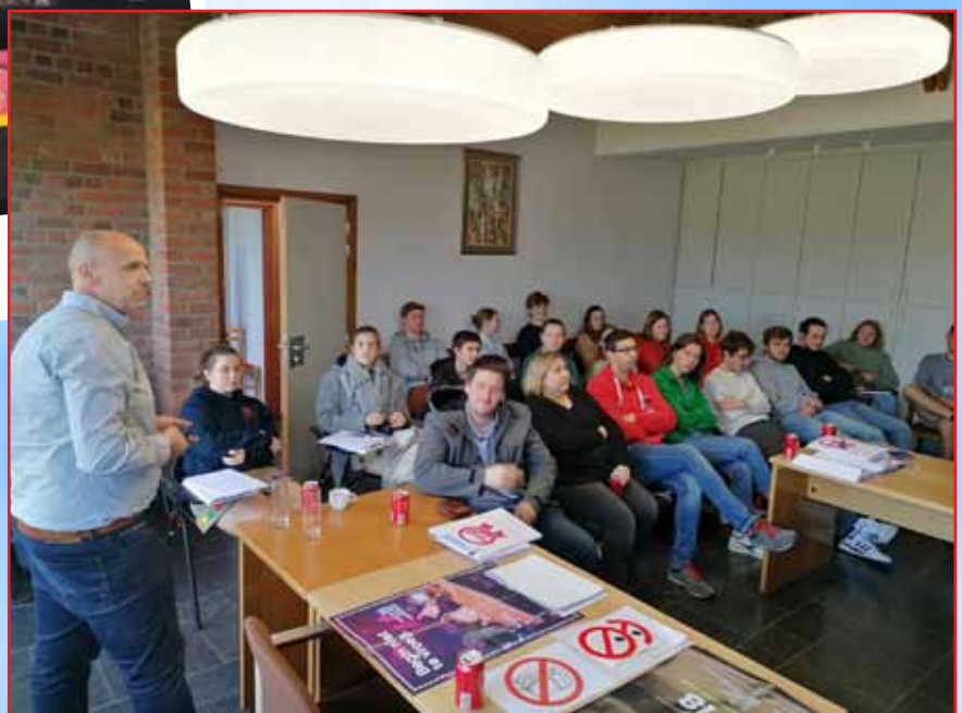
Opleiding fuifcoach onderdeel theorie 12 maart