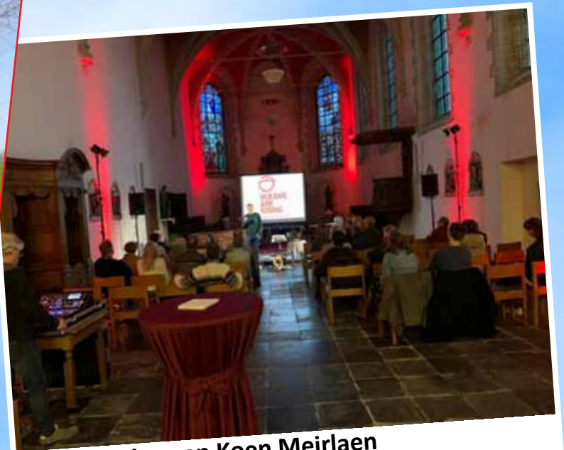
Klimaatlezing van Koen Meirlaen 30 maart