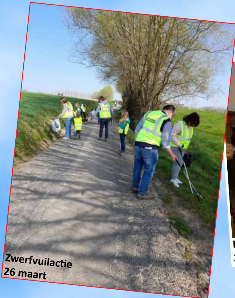
Zwerfvuilactie 26 maart