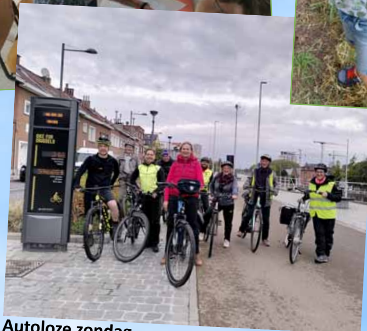
Autoloze zondag 18 september