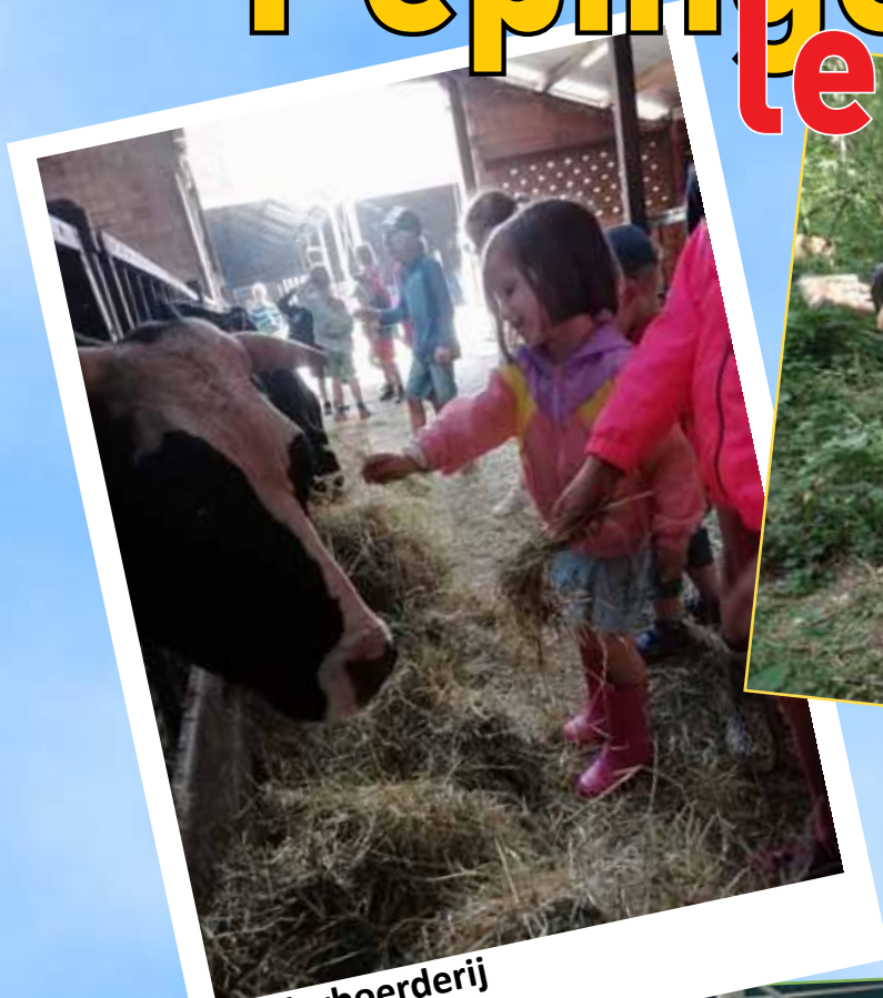
Kinderboerderij 1 juli