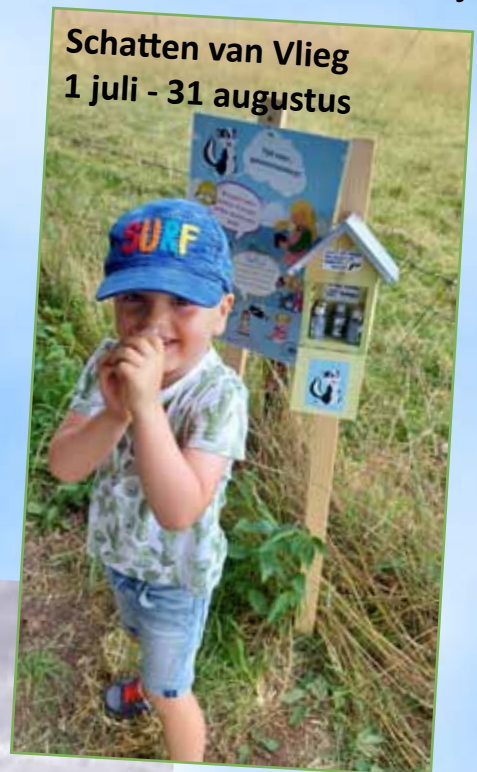
Schatten van Vlieg 1 juli - 31 augustus