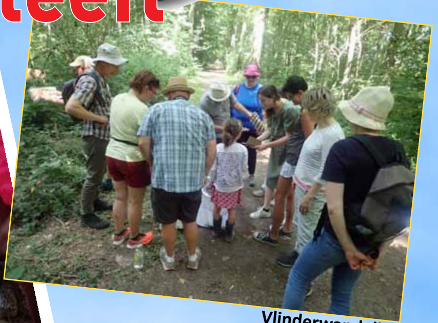
Vlinderwandeling 17 juli