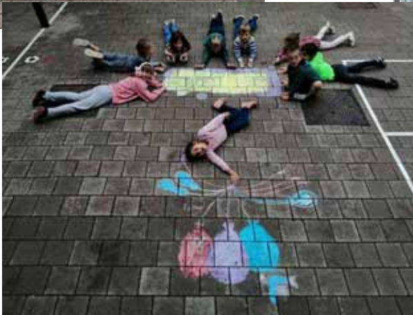
Harten Troef - 2B