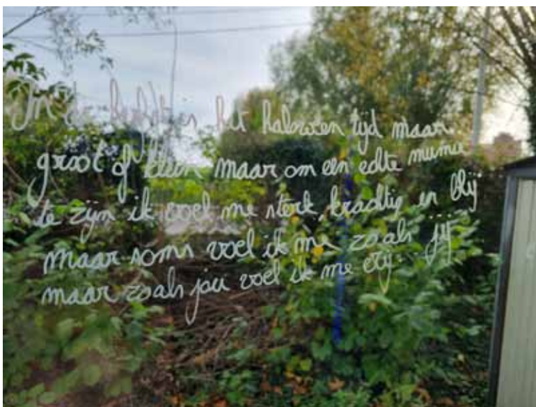
SIV 6e leerjaar