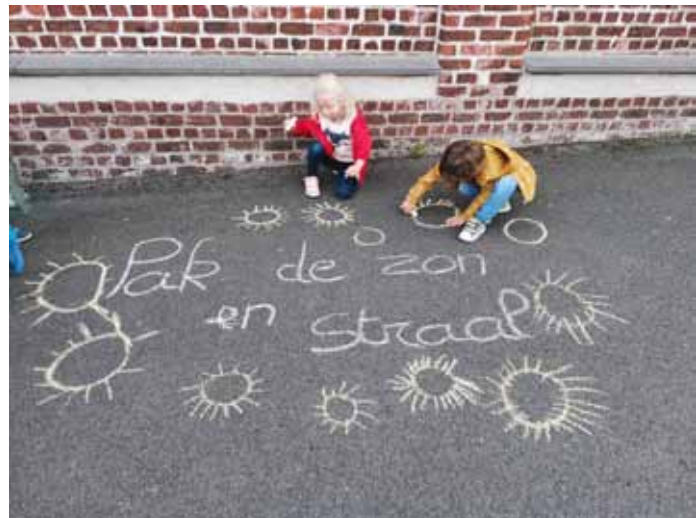
Harten Troef- 3KKA