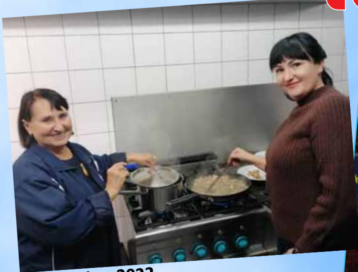
9 december 2022 Europese avond kookworkshop