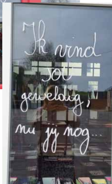
SIV 5e leerjaar