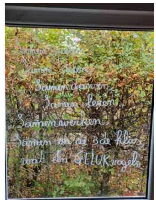
SIV 3e leerjaar