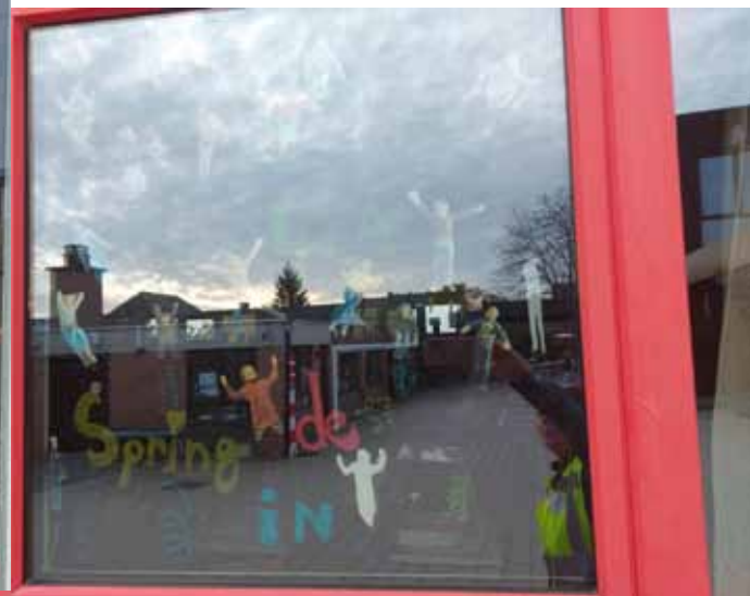
Harten troef - 4A