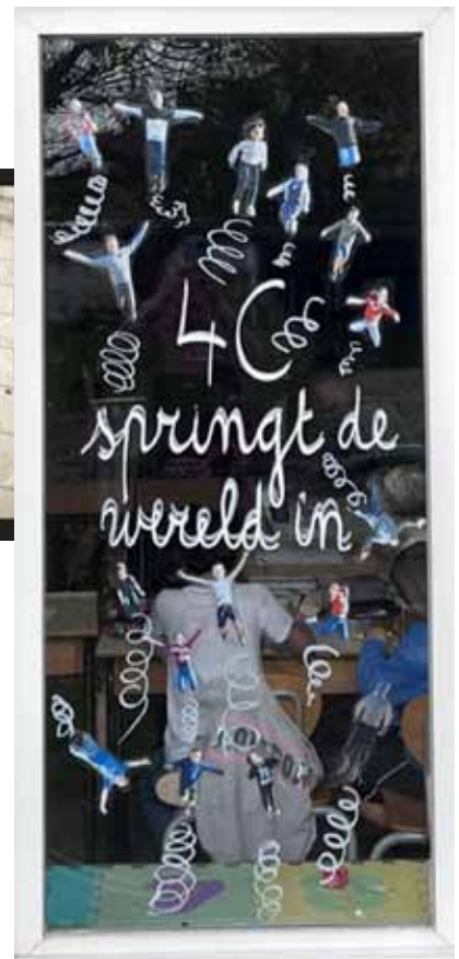
Harten Troef - 4C