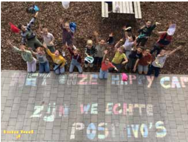
Harten Troef - 5B