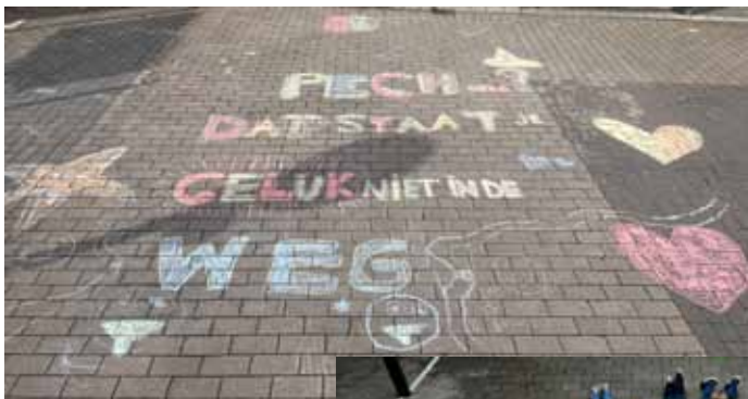
Harten Troef - 6A