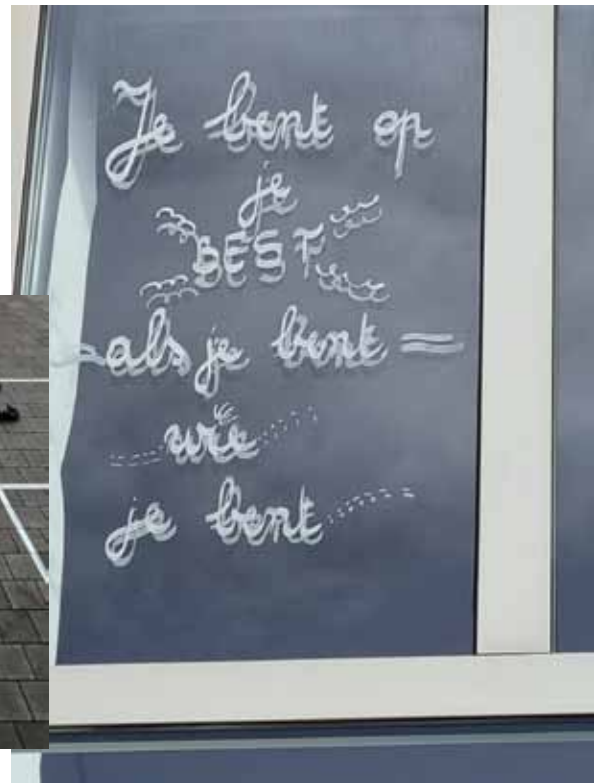
SIV 4e leerjaar