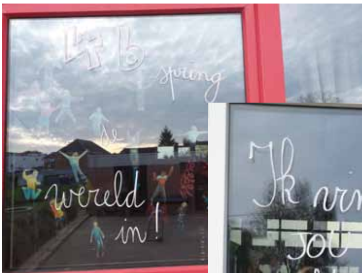
Harten Troef - 4B