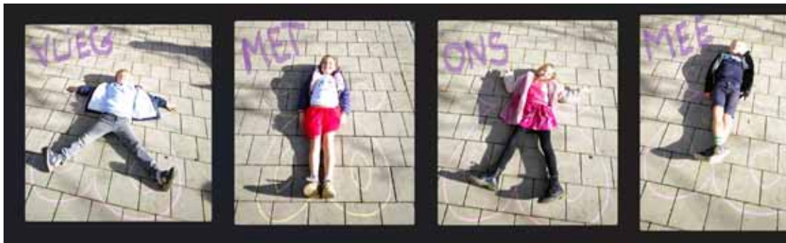
Harten Troef - 3KKB

makkelijke taak was! Uiteindelijk viel de keuze op 6A van de school Hartentroef als winnaar, op de 2de plek kwam het 6de leerjaar van Spring in't Veld en op de derde plek staat 3KKA van Harten Troef. Alle foto's zijn echter zo leuk dat ze het verdienen om gepubliceerd te worden in het info-krantje.