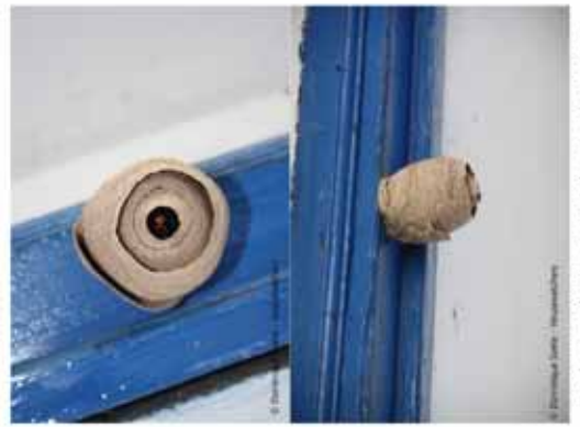
Onder- en bovenaanzicht voorjaarsnest