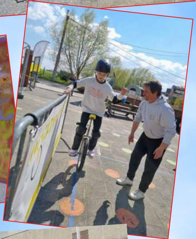
Kijk ik fiets! 26 april