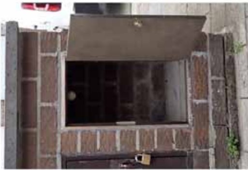
Voorjaarsnest in brievenbus

Als het warmer wordt dan 15°C, worden Aziatische hoornaarkoninginnen wakker en zoeken ze een plek om een nest te maken. Ze kiezen vaak beschutte plekken die door mensen zijn gemaakt, zoals schuurtjes, afdakken of luifels, ... Ook in struiken kan een koningin een nieuw nest maken. De voorjaarsnesten bevinden zich meestal dicht bij de grond.