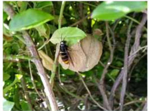
Voorjaarsnest in struik