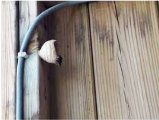
Voorjaarsnest in tuinhuis