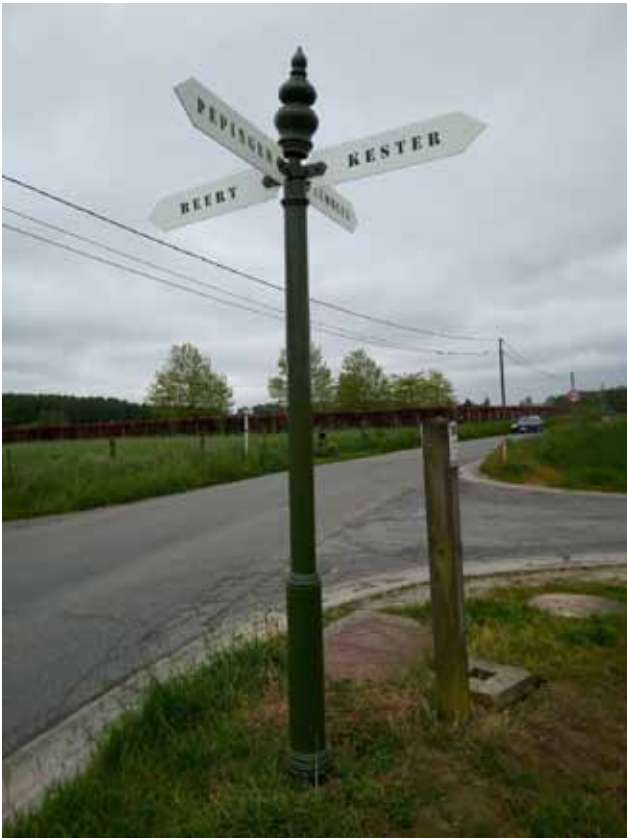
Wegwijzer 1 - kruispunt van Kattenholstraat, Trapstraat, Dreef en de Steenweg op Bellingen