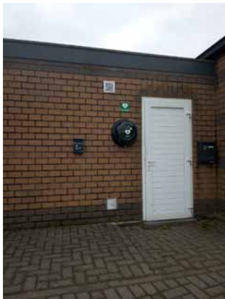
AED toestel Bellingen

Vorige week werden de AED's in Zaal De Kring te Bellingen, 't Schoolhuys te Bogaarden en aan het plein in Heikruis geplaatst en klaargemaakt voor eventueel gebruik. Met deze aankoop stijgt de overlevingskans van een slachtoffer bij een hartstilstand. Om de eerstehulpcapaciteiten van de bevolking te vergroten, zal de gemeente daarnaast jaarlijks in het najaar een cursus 'reanimatie en AED-gebruik' aanbieden voor alle geïnteresseerden.