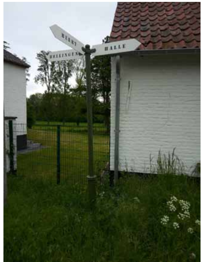
Wegwijzer 4 - kruispunt van de Grote Baan, Trapkensstraat en de Eikstraat