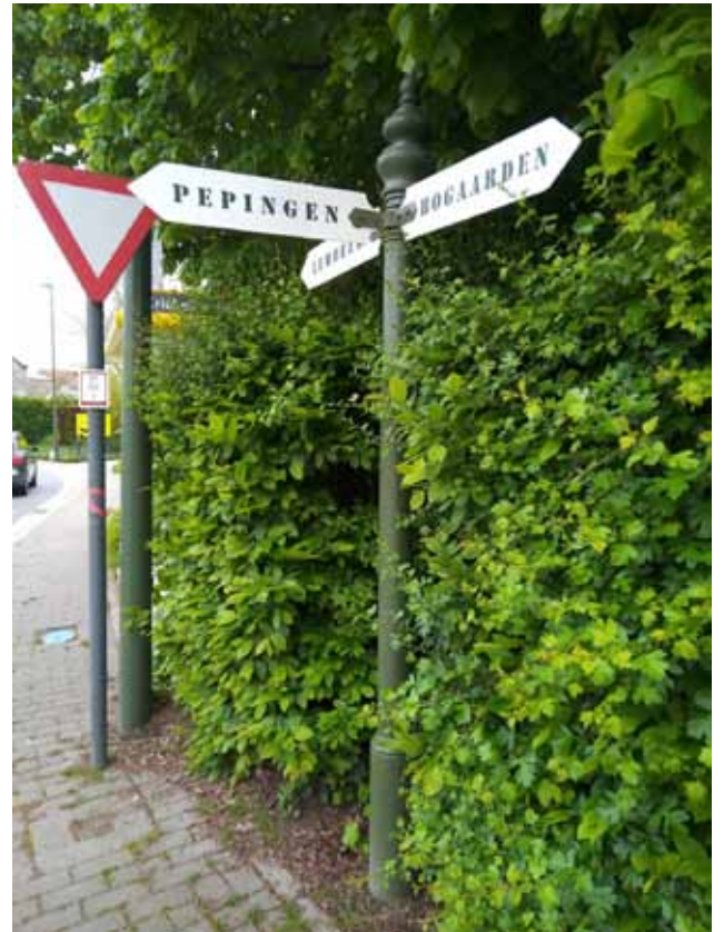
Wegwijzer 2 - kruispunt van de Kriekelaerestraat, Trapstraat en de Nieuwe Baan