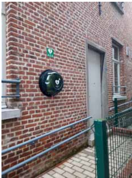
AED toestel Bogaarden