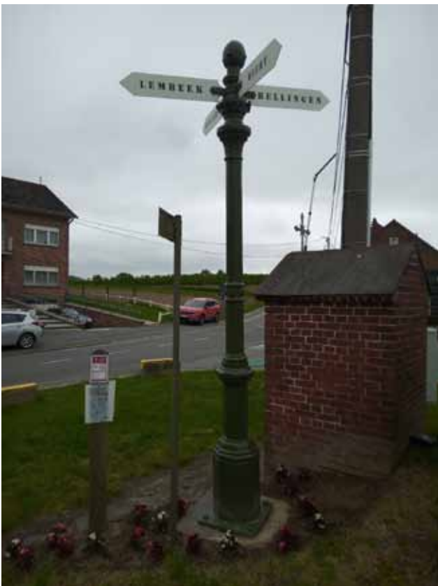
Wegwijzer 3 - kruispunt van de Nieuwe Baan, Veldstraat en Hondzochtstraat