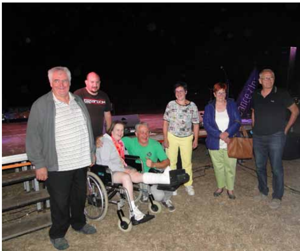
Winnaars sportprijs 2022

Kandidaturen voor de sportprijs (vereniging / individueel) of voor sportkampioenen mogen vanaf heden tot ten laatste 13 augustus 2023 ingediend worden bij de sportdienst in het gemeentehuis ofwel via sport@pepingen.be . De in te vullen formulieren kunt u verkrijgen bij de sportdienst of op de website www.pepingen.be .