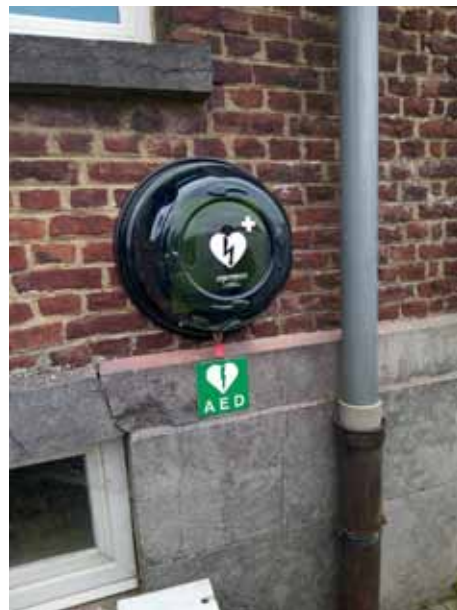
AED toestel Heikruis