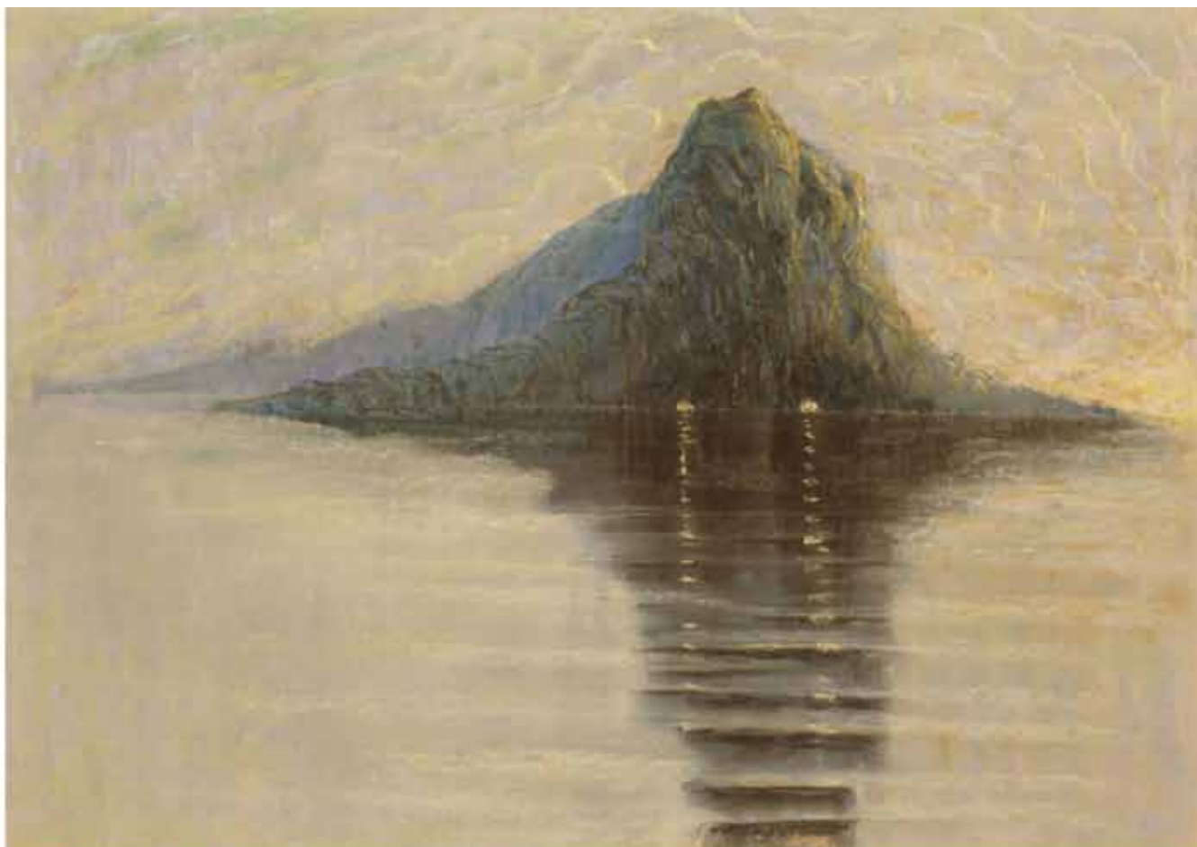
M.K. Čiurlionis, 'Serenity' (1904-05)