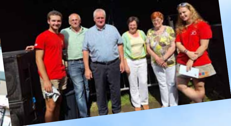
50 jaar chiro Karreveld 3 september