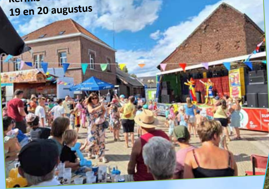
Kermis 19 en 20 augustus