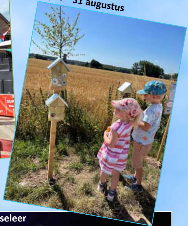
Schatten van vlieg 1 juli – 31 augustus